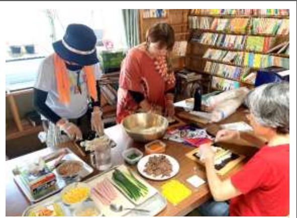
キンパ作りの様子。米が多いとうまく巻けない

ヘルプセンター・すきっぷでは、毎年松野農園で交流会をしています。普段グループホームでは2~3人で仕事をしていて、顔と名前が一致しない支援者が多い中、参加者みんなで楽しくおしゃべりしながら料理を作り、親睦を深めています。今年はバーベキューとキンパ、チヂミ作りをしました。