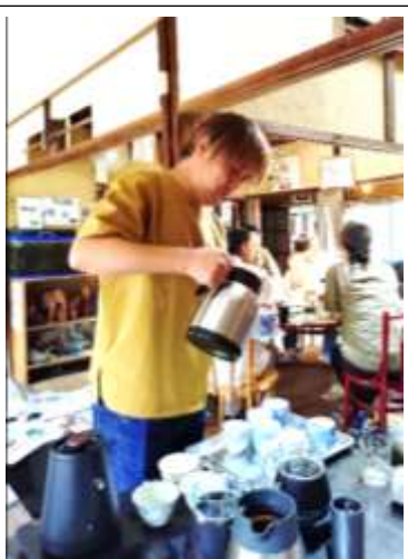
自家焙煎のコーヒーも美味

料理の得意なヘルパーが秘伝のレシピで焼いてくれたチヂミは、本格的な美味しさで大好評でした。昨年何人もヘルパーとして友人を紹介してくれている学生は、その友人と参加しました。昔ながらの家屋や庭や畑を活用している松野農園に初めて訪れ、「おじいちゃんの家みたい」と驚いていました。暑い中、楽しそうにバーベキューコンロでお肉を焼いて参加者にふるまってくれました。若さもあつてか、みんな驚くくらい食べっぷりがよく、美味しそうに食べてくれるので、作った人達も作り甲斐があるよと喜んでおられました。